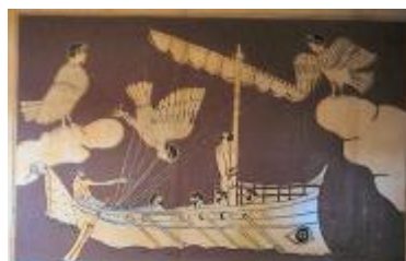
Tapiserie de l'Odyssée