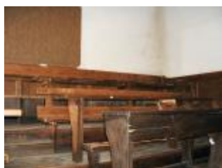
Salle H. Gazeau