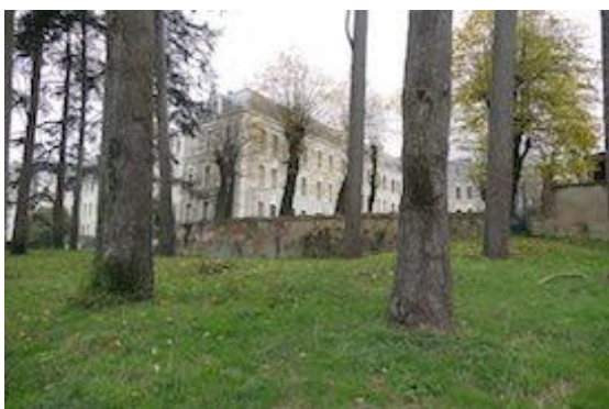
l'aile est du bâtiment