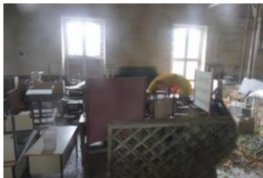
la salle Saint Augustin