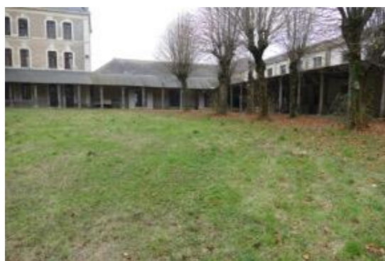
l'ex-cour des grands