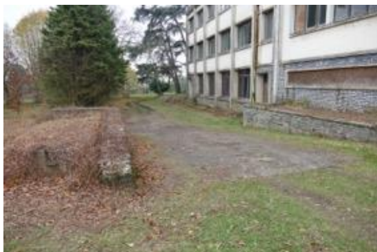
l'ex-plaine des sports

Nous avons pu ainsi voir les parties suivantes :