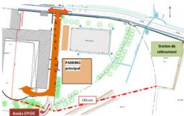
Schéma de principe de la première phase

Par ailleurs, il a été convenu que la cour du lycée, dont la moitié appartient désormais à la commune, gardera sa physionomie d'antan et qu'aucune construction nouvelle n'y sera implantée afin de ne pas dénaturer l'aspect d'origine qui contribue à l'allure générale du vieil édifice. La cour sera mutualisée entre les deux structures.