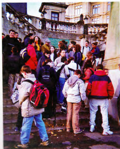
Les élèves de Combrée à Bath.

Mardi matin nous avons quitté Portsmouth en direction de Londres. Une longue journée nous attendait. Lorsque nous sommes arrivés dans la capitale, notre chauffeur nous a fait une visite commentée des hauts lieux de Londres : Westminster Abbey, The Parliament, Big Ben, Tower Bridge, The City, Buckingham Palace. Après avoir pique-niqué dans St James'park nous sommes allés visiter le musée de Madame Tussaud. Cet endroit magique a beaucoup intéressé nos élèves. En fin de soirée, nous sommes arrivés à Cheltenham où les familles d'accueil nous attendaient avec impatience.